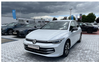
AUTOHAUS REISINGER WIR BEWEGEN MENSCHEN.