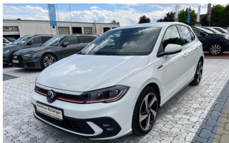
AUTOHAUS REISINGER WIR BEWEGEN MENSCHEN.