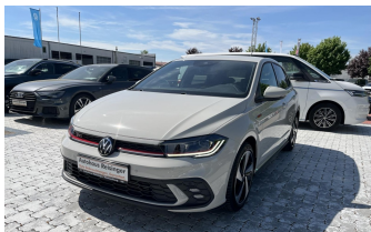
AUTOHAUS REISINGER WIR BEWEGEN MENSCHEN.