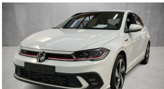
AUTOHAUS REISINGER WIR BEWEGEN MENSCHEN.