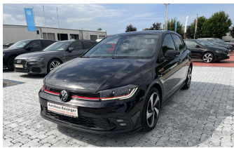
AUTOHAUS REISINGER WIR BEWEGEN MENSCHEN.