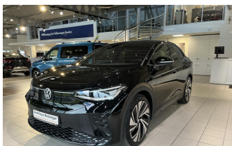
AUTOHAUS REISINGER WIR BEWEGEN MENSCHEN.

beheizbares Lenkrad blendfreies fernlicht (matrix) dab-radio einparkhilfe kamera 360 elektrische Heckklappe elektrische Seitenspiegel elektrische Sitzeinstellung head-up display induktionsladen Smartphones mp3 Schnittstelle schlüssellose Zentralsverriegelung