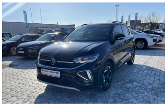
AUTOHAUS REISINGER WIR BEWEGEN MENSCHEN.