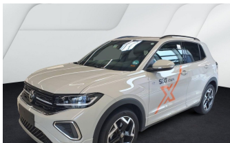
AUTOHAUS REISINGER WIR BEWEGEN MENSCHEN.