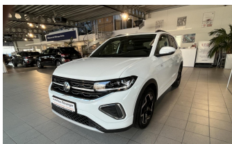
AUTOHAUS REISINGER WIR BEWEGEN MENSCHEN.