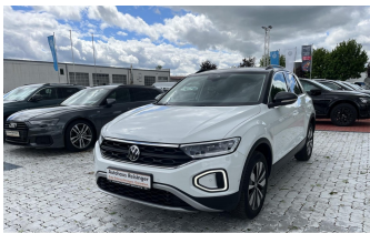
AUTOHAUS REISINGER WIR BEWEGEN MENSCHEN.