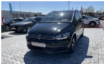
AUTOHAUS REISINGER WIR BEWEGEN MENSCHEN.