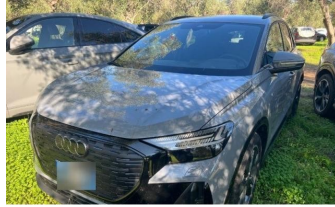
AUTOHAUS REISINGER WIR BEWEGEN MENSCHEN.