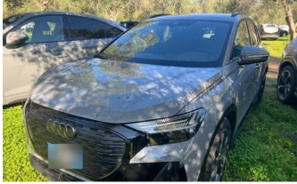
AUTOHAUS REISINGER WIR BEWEGEN MENSCHEN.

induktionsladen Smartphones mp3 Schnittstelle volldigitales Kombiinstrument